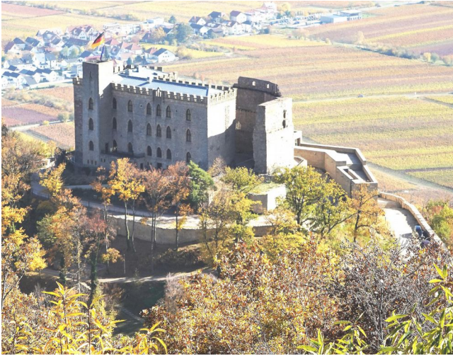
Bilder: Hambacher Bergstein, Hambacher Schloss von K. Krämer Text: T. Krüger

seinem letzten Betriebstag bewirtet hat – kein Problem, bis zu unserer Abschlussrast in der Wappenschmiede ist es nicht mehr weit.